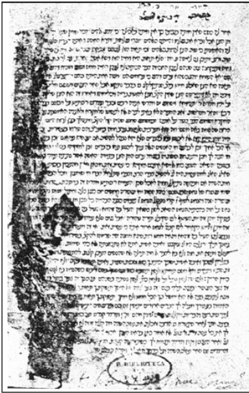
Primera página del comentario de Rashi al Pentateuco. Impreso en Reggio di Calabria por Abraham Garton en 1475.