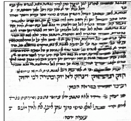
Página de los comentarios de Rashi a la Biblia (Manuscrito de mediados del siglo XIII)

lenguas, filosofía y ciencias. Al terminar sus estudios volvió a su ciudad natal donde había heredado viñedos que trabajó toda su vida y le permitieron vivir holgadamente, estudiando, enseñando, practicando tzedaká especialmente entre sus alumnos. Estos fueron muchos ya que su extraordinaria sabiduría lo convirtió en maestro de maestros.